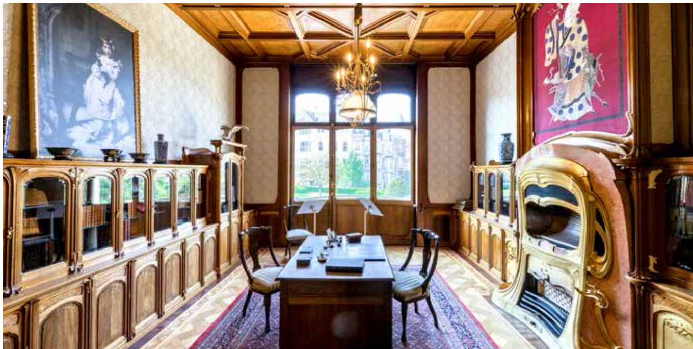
Het Hotel Aubecq aan de Louizalaan, in 1949, voor de afbraak © Jos Vandenbreeden, architect

In de voormalige garage wordt een digitale installatie gepresenteerd over het hotel Aubecq, waarvan de 600 stenen momenteel door het Brussels Gewest worden bewaard.